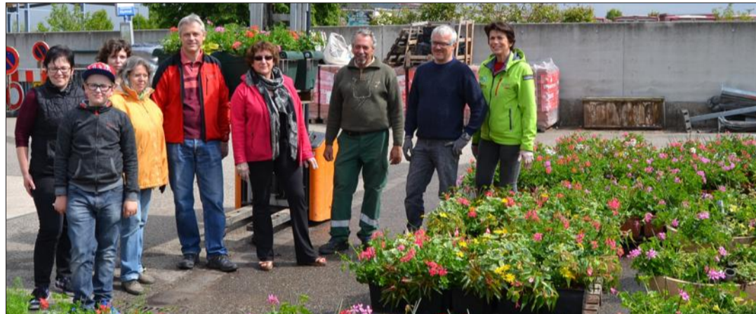
Vasques et jardinières sont prêtes à embellir le village.

La commune prépare les festivités marquant les 50 ans du jumelage entre Scherwiller et Fautenbach, qui auront lieu dimanche 21 mai. Dans ce contexte, le fleurissement représente un surcroît de travail temporaire et les fleurs doivent être en place pour cette date. La municipalité a lancé un appel et plusieurs adjoints, conseillers et bénévoles aimant les fleurs ont accepté de donner un coup de main pour réali-